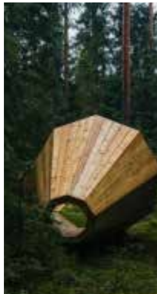
Taal & Klanken