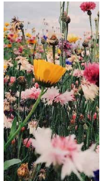
Bloemen & plantenmannen

LANDSCHAP / ARCHITECTUUR / RESTAURATIE / STEDENBOUW